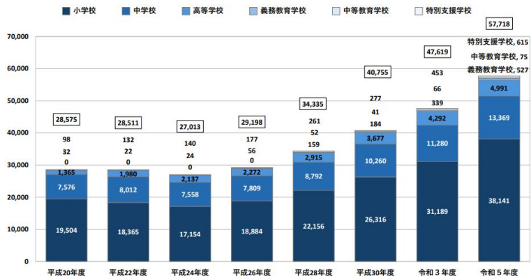
特別な配慮に基づく指導を受けている者の割合（単位：%）